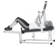
Zielgerichtetes Training des M. transversus

Optimierung und Aufbau der haltungsstabilisierenden Muskeln in unterschiedlichen Bewegungsebenen.