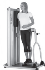
Training der lateralen Rumpf-Muskulatur

Erlernen von Kombinationsübungen für Haltungsstabilisierung und Bewegungsmuskulatur.