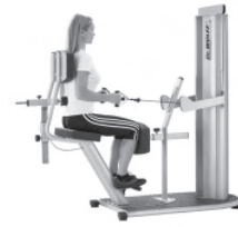
Stabilisation im Sitzen

Erlernen der gezielten Ansteuerung der Muskeln M. transversus abdominis und M. multifidus lumbalis .