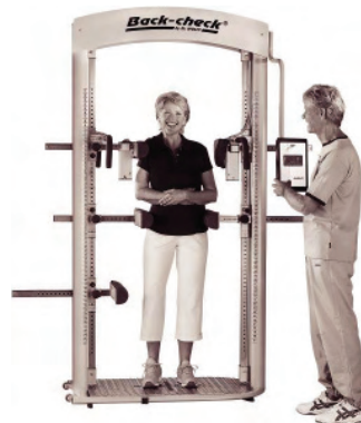
Diagnostik und Verlaufskontrolle mit Back-Check®