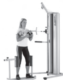
Training der Rotation