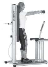
Stabilisation im aufrechten Stand

Übertragung der erlernten Stabilisation auf Alltagsbewegungen.